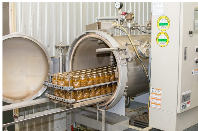
高温高圧加熱処理装置(レトルト殺菌釜)