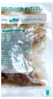
電子レンジ対応のレトルトパウチ入り