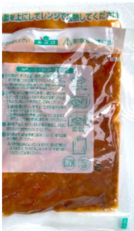
電子レンジ対応のレトルトパウチ入り