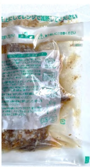
電子レンジ対応のレトルトパウチ入り