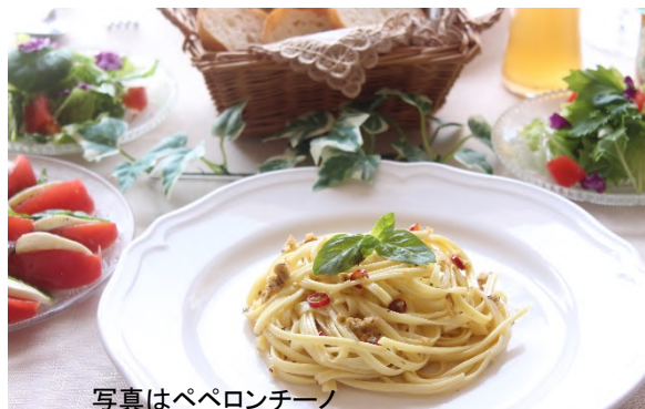
写真はペペロンチーノ

共栄食糧のパスタは、ゆで時間3分とお待たせしません！自慢の凸凹形状にソースがよく絡みつき、どんなソースも余すことなくおいしくいただけます！